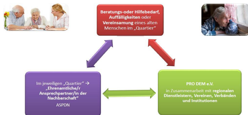
Grafik: Das Weyher Quartierskonzept in der Seniorenarbeit

Um die Anliegen, Sorgen und Probleme der Senioren in den jeweiligen Quartieren zu erkennen und einen schnellen, direkten Kontakt zu den Anwohnern zu erhalten, hat PRO DEM e.V. ein Netzwerk von Ehrenamtlichen innerhalb der einzelnen Quartiere aufgebaut. Diese ehrenamtlichen „Ansprechpartner der Nachbarschaft“ (Abkürzung ASPDN) fungieren als „Sensor für das Quartier“. Ihre Rolle ist vergleichbar mit der der Ortsvorsteherinnen und Ortsvorsteher in Osterholz-Scharmbeck. PRO DEM und die Gemeinde Weyhe konnten 90 Ehrenamtliche für diese Arbeit gewinnen. Die ehrenamtlichen Ansprechpartner werden von einer hauptamtlichen Quartiersmanagerin unterstützt. Regelmäßige Treffen innerhalb des Quartiers, aber auch Vorträge rund um das Thema Alter(n) sowie gute Gespräche am und über den Gartenzaun sollen das Leben im Quartier wieder bunter machen.