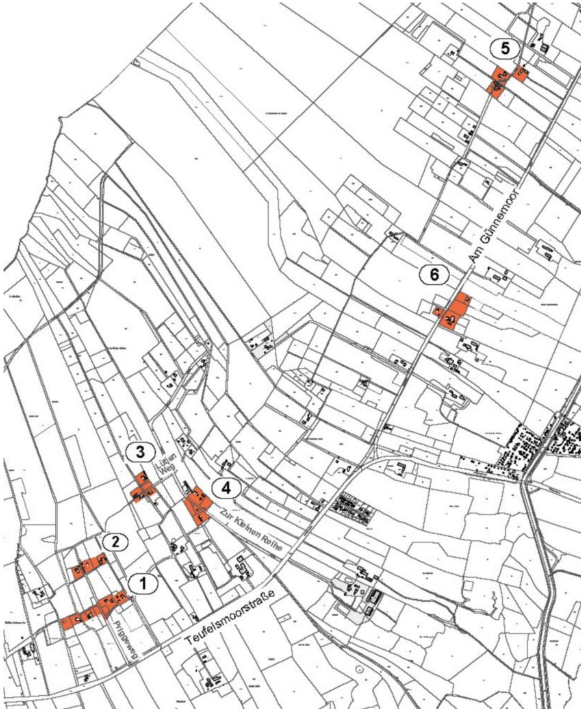
Abbildung 2: Räumliche Lage der sechs Teilbereiche der Satzung, ohne Maßstab.