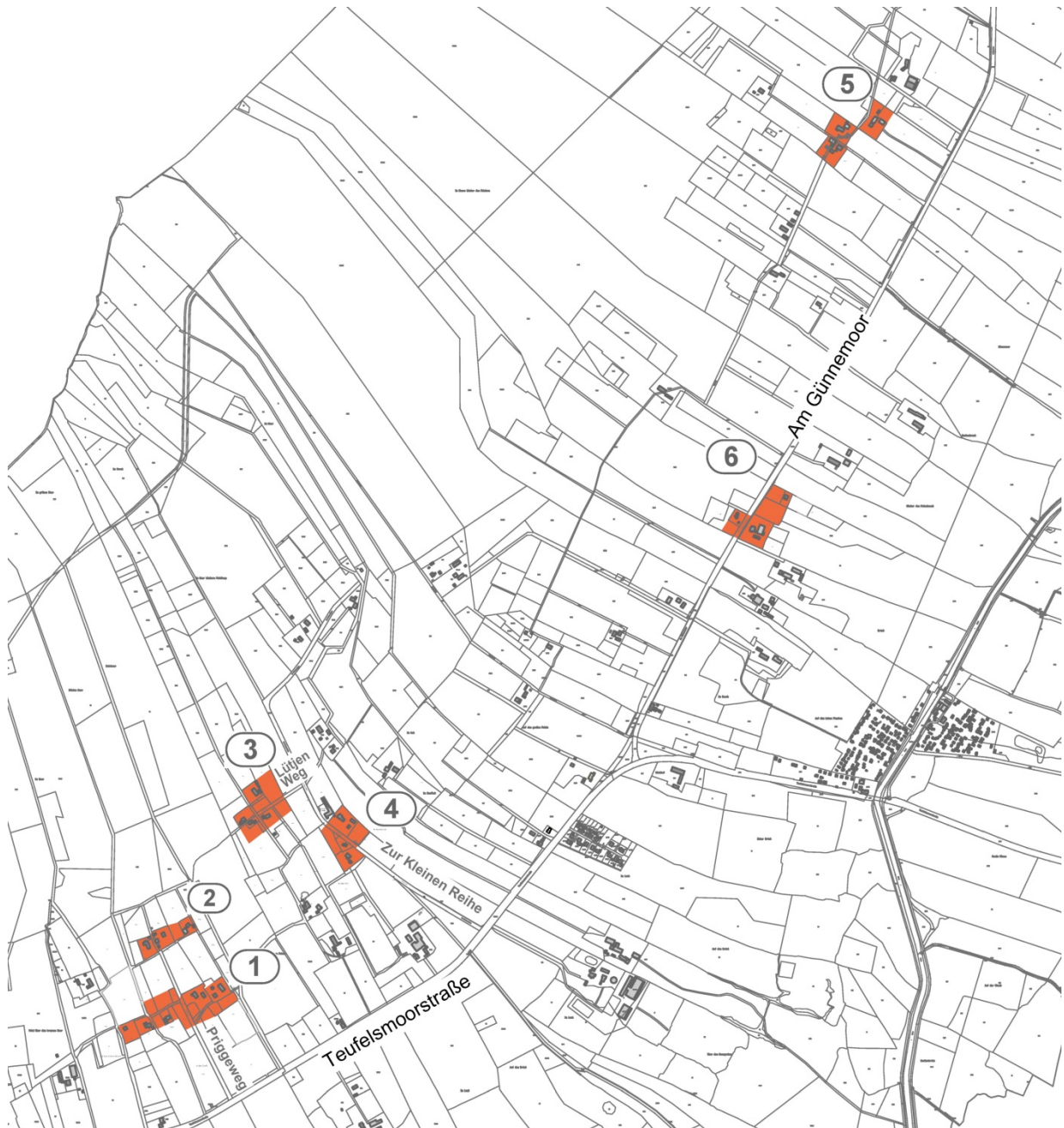
Abbildung 2: Räumliche Lage der sechs Teilbereiche der Satzung, ohne Maßstab.