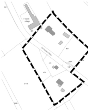
Teilbereich 4: Zur Kleine Reihe