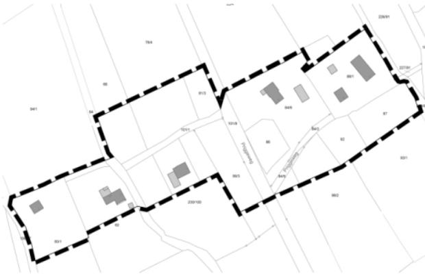
Teilbereich 1: Priggeweg