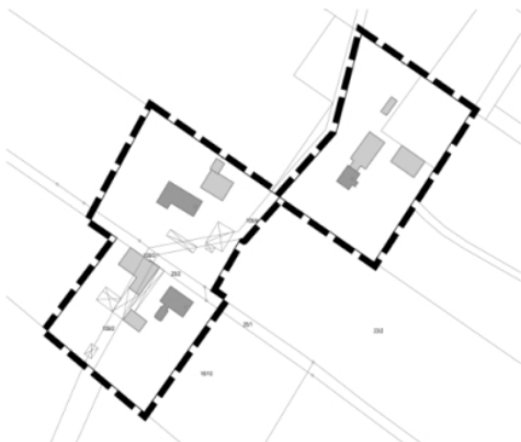
Teilbereich 5: Am Günnemoor