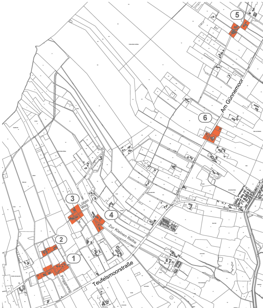
Anlage 1: Abgrenzung des Geltungsbereiches der sechs Teilbereiche der örtlichen Bauvorschrift Außenbereichssatzung Teufelsmoor.