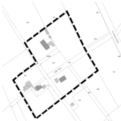
Teilbereich 3: Zur Kleinen Reihe