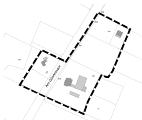
Teilbereich 6: Am Günnemoor

Anlage 2: Übersicht der sechs Teilbereiche der örtlichen Bauvorschrift Außenbereichssatzung Teufelsmoor.