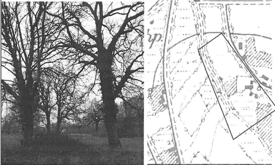
Abb. 1: Kastanie & Eiche auf dem westlichen straßenseitigen Grundstück Abb. 2: die Preußische Landesaufnahme: Wallhecken am westlichen Rand des Gebiets

Berhalb der Zeit von März-September und nur nach Untersuchung auf Höhlen durch eine fachkundige Person durchzuführen. Zudem fallen die Gehölze unter die Regelungen der Baumschutzsatzung der Stadt Osterholz-Scharmbeck.