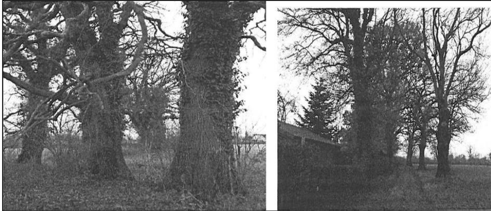
Baum-Wallhecke am Südweststrand des Plangebiets Variante 1