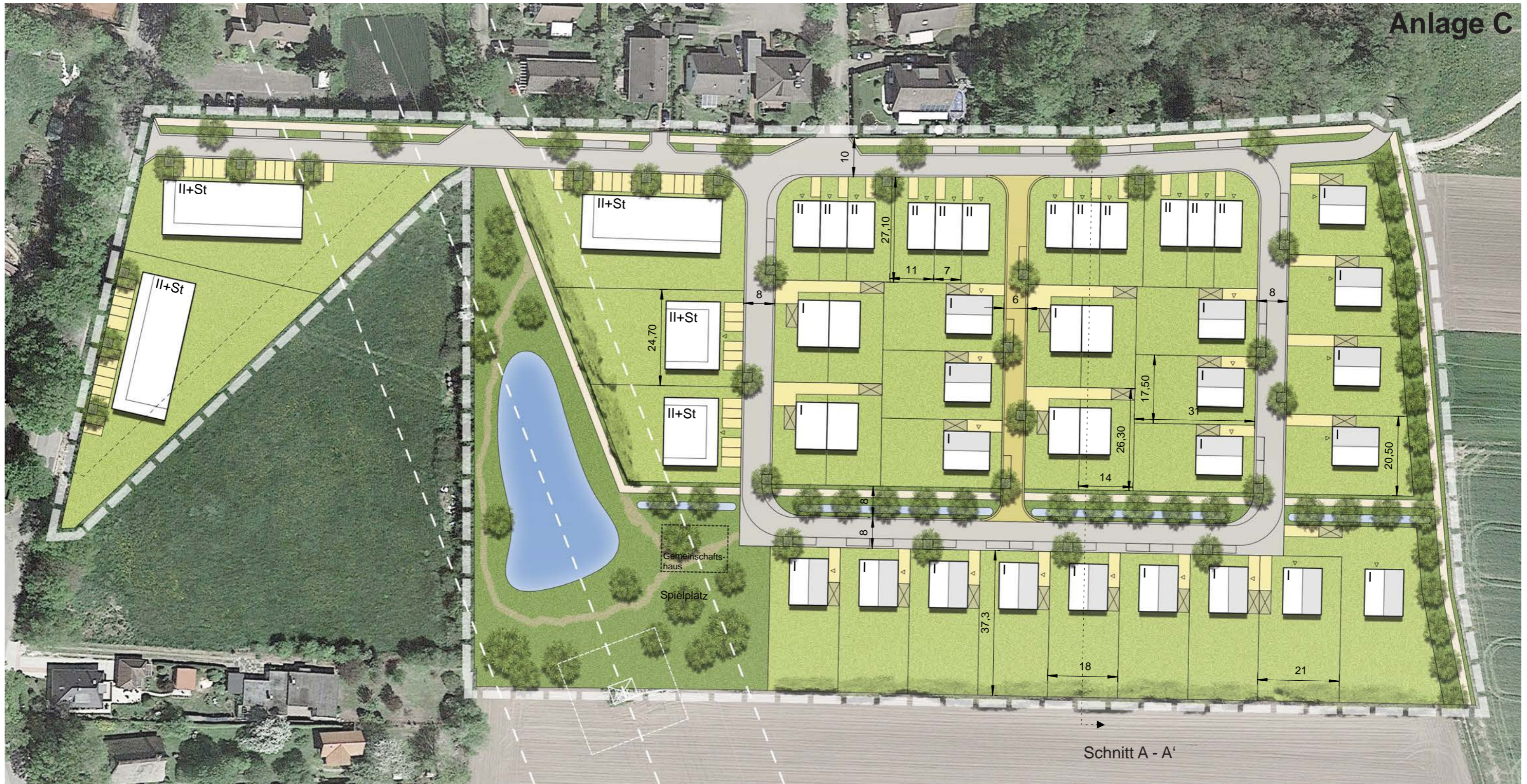
Schnitt A - A'