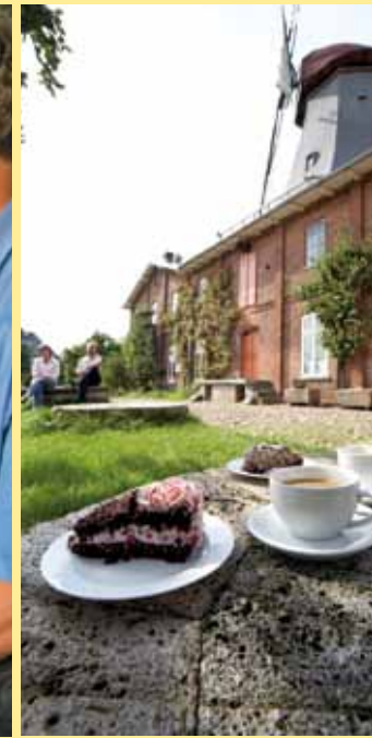
1 Genießen im Biergarten– 2 Blick aufs Mühlencafé