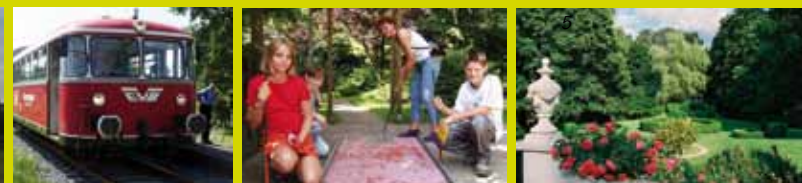
1 Tiergarten Ludwigslust – 2 Moorexpress – 3 Minigolf – 4 Barkenhoff