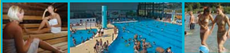
1 Allwetterbad – 2 Sauna – 3 Allwetterbad als Freibad – 4 Ohlenstedter Quellseen