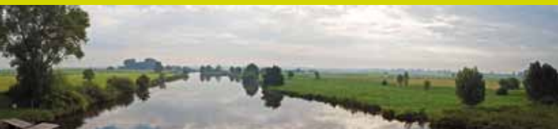
1 Ausflug mit dem Rad – 2 Hammeniederung