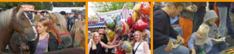
1 Fest auf Gut Sandbeck – 2 Viehmarkt – 3 Rummel – 4 Flohmarkt