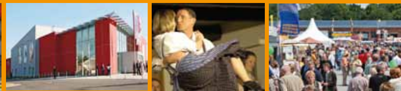
1 Feiern in der Stadthalle – 2 Stadthalle – 3 Scharmbecker Speeldeel – 4 Publica