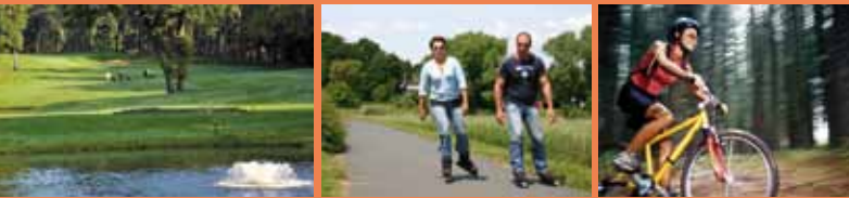
1 Segelfliegen – 2 Golfen – 3 Skaten – 4 Biken