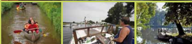
1 Boote auf der Hamme – 2 Paddeln – 3 Motorboote – 4 Melchers Hütte