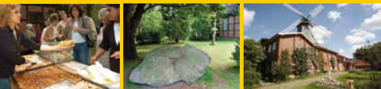
1 Museumsanlage – 2 Sommerfest – 3 Gut Sandbeck – 4 Mühle von Rönn