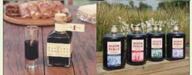
JAN TORF Feiner Kräuterbitter-Liqueur, BITTERE TROPFEN, MOORPERLE, Feiner Aquavit und Liqueur-Spezialitäten