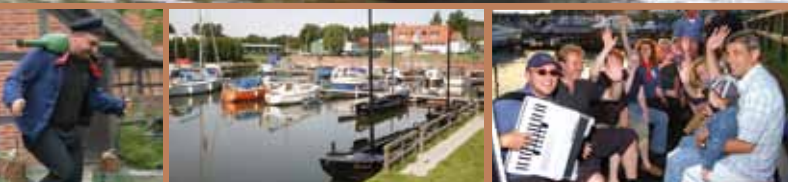
1 Moorteufel auf Tour – 2 Torfschifferpatent – 3 Torfhafen – 4 Hammenacht im Hafen